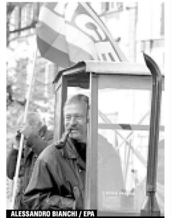
Bove, Porto Alegren.