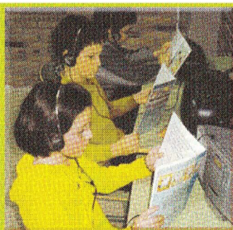
LEHEN HEZKUNTZA: 6 urtetik 12ra