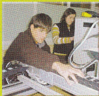
BATXILERGOA ETA LANBIDE HEZIKETA: 16 urtetik gora