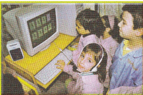
HAUR HEZKUNTZA: 2 urtetik 6ra

Alberto Ormaetxeak zuzendu zuen talde txapelduna, eta gaur egungo Realaren ibiliaren zergatia argi dauka: «Realaren gakoa da denek partitura dakitela». Hain justu, Arkonadak euren garaiko taldeaz esandakoaren antzekoa: «Taldea memoriaz jokatzeko zuen; bakoitzak bazekien zein zen bere egitekoa». Bada zerbait.