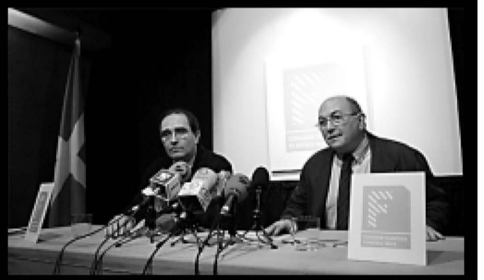
Euskal Filmtokaren logotipo berria aurkeztu zuten atzo.

Saint Paul/Saint Pierre elizaren barruan dauden etorkin gaur kanporatzeko eskatu dio Calaisko alkateak Frantziako Barne ministro Nicolas Sarkozyri. Etorkinak larunbatean sartu ziren elizan eta hilabeteko baimen agiri bat eskatu dute Pas de Calais aldean libre ibiltzeko. Etorkin asko Kosovoko eta Kurdistango iheslariak eta Europako Ekialdeko herritarrak dira. Etorkinek Erresuma Batura joan nahi dute, Londresko legeak Pariskoak baino malgutasun handiagoa eskaintzen baitu etorkinak hartzeko. Lehenago Calais ondoko Sangatteko babesleku zuten aterpe, baina Frantziako Gobernuak Gurutze Gorriak kudeatzen zuen egoitza itxi du.