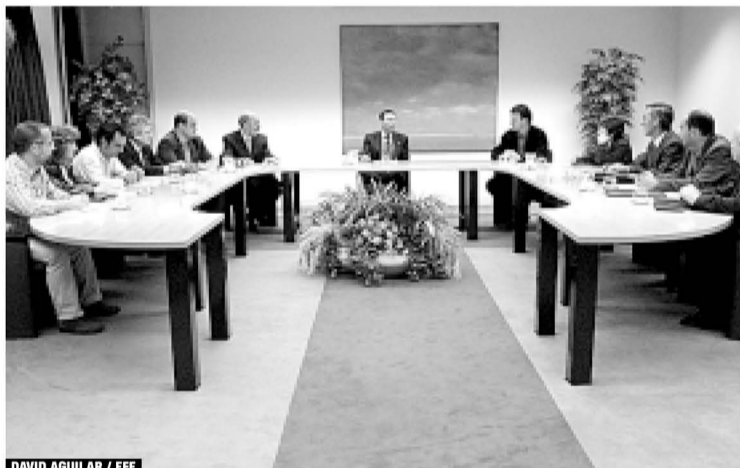
Hezkuntza munduko eragileak lehendakariarekin bildu ziren unean.