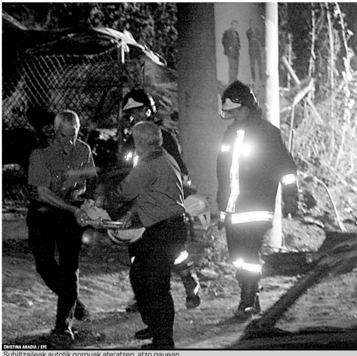
Suhiltzaileak autotik gorpuak ateratzen, atzo gauean.

EUSKARA. Jaurlaritzaren jarrera eta UPNko gobernuarena parekatu dituzte