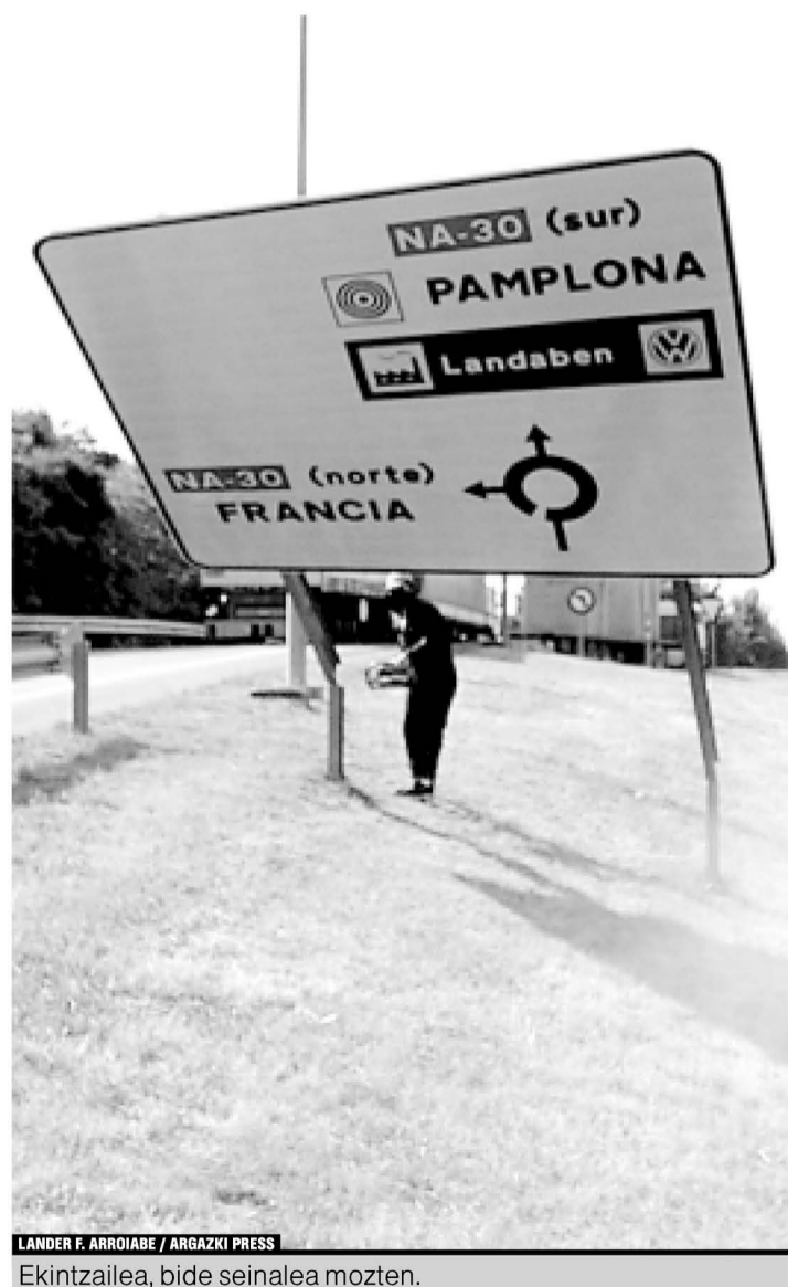
Ekintzailea, bide seinalea moztzen.

Berriozar, Sanduzelai eta Merkañu lotzen dituen biribilgunean gaztelania hutsez zegoen bide seinalea moztu zuten, eta, oharrean bidez, Jean-Francois Leforten kideek Baionan egindako ekintzarekin bat egin nahi zuten modu horretan.