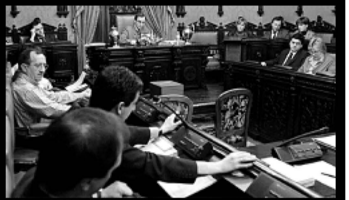
Gasteizko udaletxeko plenoko artxiboko irudia.