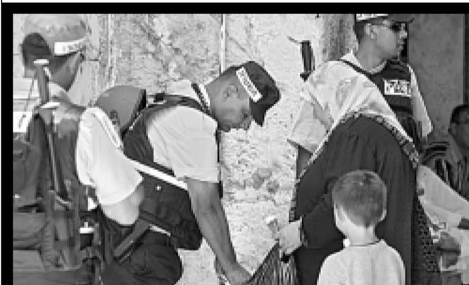
Israelgo Polizia emakume palestinar baten poltsak miatzen.