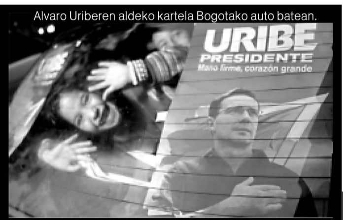
Alvaro Uriberen aldeko kartela Bogotako auto batean.