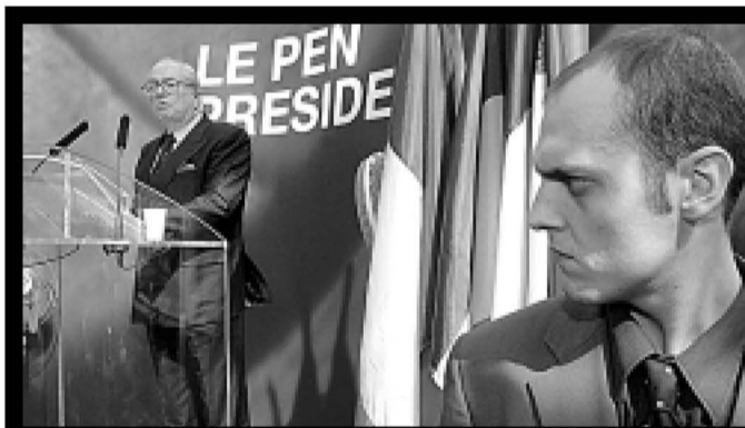
Jean Marie Le Pen, atzo, prentsaurrekoan.

Euskal Herrian ere Chirac nagusitu da, baina gainerakoan emaitzak ez dira Frantziakoan ispilu izan: Jospinek boto asko galdu ditu 1995eko bozetatik hona, baina bigarren lekuari eutsi dio, eta Le Pen laugarren hautagai bozkatuena baino ez da izan, Bayrou biarresaren atzetik. Joera aldaketarik ez, beraz, Ipar Euskal Herrian, ohi bezala eskuinari eman baitio botoa gehiengo handiak.