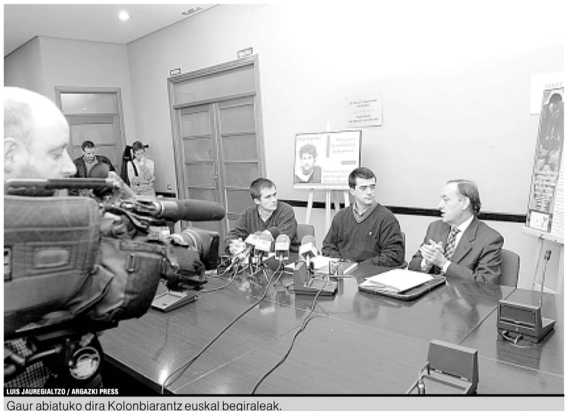
Gaur abiatuko dira Kolonbiarantz euskal begiraleak.