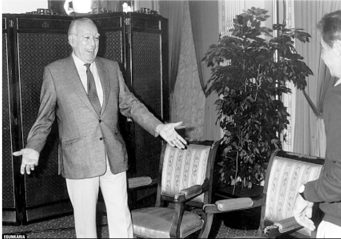
Anthony Quinn, Donostiako zinemaldian, 1995an. Ohorezko saria eman zioten, ibilbide oparoagatik.

1915ean jaio zen, Chihuahuan (Mexiko). Aita irlandarra zuen eta ama azteka, biak Pancho Villaren aldean borrokatutakoak. Berak iraultzaile odola zuela esaten zuen beti. El Pasora joan ziren gurasoak bi urte zituela, Texasera, eta emigranteek lan egiten zuten lurretan batetik bestera igaro zuen haurtzaroa, Kalifornian. Zineman hasi au-