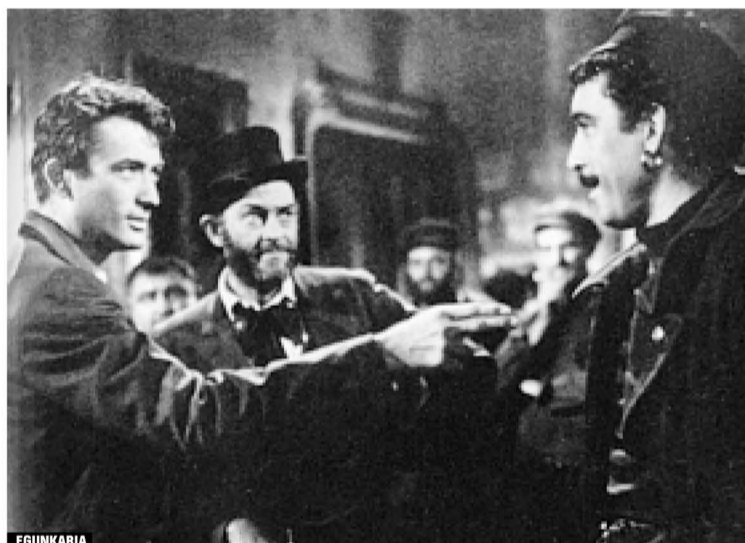
Raoul Walshen The Warm in His Arms filmean, Gregory Peckekin.