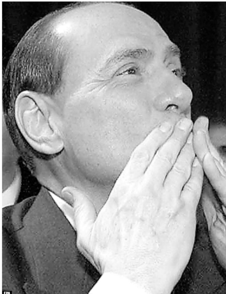
Ezkerrean, Silvio Berlusconi Askatasunen Etxea koalizioko hautagaia pozik hauteskunderen emaitzekin. Eskuinean, Rutelli, burumakur.

Mendebaldeko prentsaren kritikak jaso dituen arren, Europako Batasunak ez du askorik esan Berlusconi demokraziari egin liezaiokeen kalteaz. Azken urteotan hori saihesteko lana egin du Forza Italiako buruak Milango gotorlekutik. Aznarren eta besteren laguntzari esker sartu da Il Cavaliere -ren taldea Europako Alderdi Popularrean. Orain prest dago Erromako forora itzultzeko.