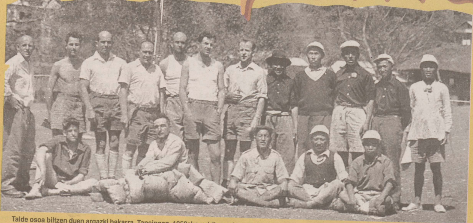
Talde osoa biltzen duen argazki bakarra, Tansingen, 1950eko apirilaren 1ean. Zutik: Louis Lachenal, Jean Couzy, Marcel Schatz, Jacques Oudot, Lionel Terray, Maurice Herzog eta Francis de Noyelle. Eserita: Gaston Rebuffat eta Marcel Ichac. Besteak espedizioako sherpak dira.