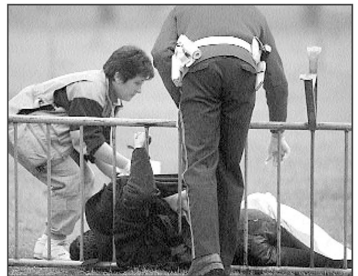
DAVID AGUILAR / EFE