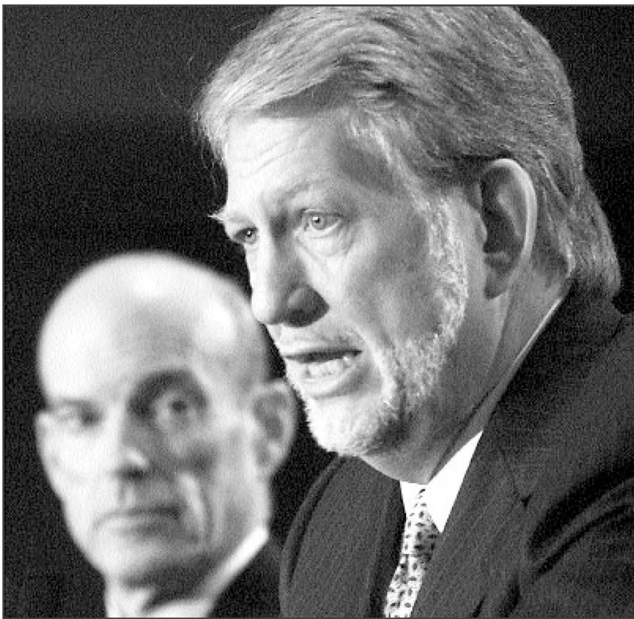
Bernard J. Ebbers MCI WorldComeko presidentea hizketan eta William T. Esrey Sprinteko entzuten, atzo bategitea aurkezteko ekitaldian.

ko du 129.000 milioi dolarretan, hau da, 20,12 bilioi pezeta edo 805.000 milioi liberatan. Bategitea ez da gauzatzeko datorren urte erdia arte, monopoliorik izan ez dadin Europako eta EEBBetako agintarien oniritzia behar baitu.