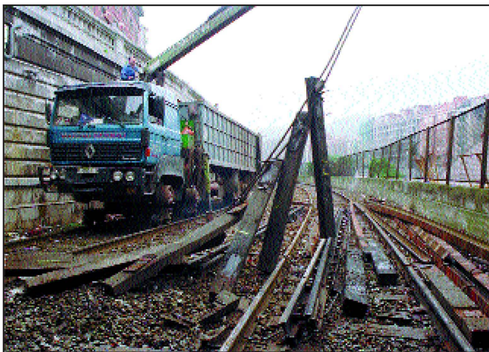
Trenbidea kentzeko lanak Ezkerraldean.

Azken urteotan, Bilboko erretiratuak eraikuntza lanetan espezializatzen ari direla dirudi, eta ehunka lagun biltzen dira lanak nola doazen ikustera. Hala ere, trenbidea kentzeko beste misteriorik ez duelako edo, lan hauetara bildu diren ingeniariek beste askotan baino komentario, az-