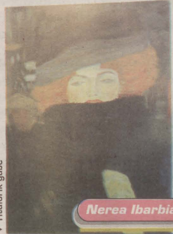
▼ Titulorik gabe