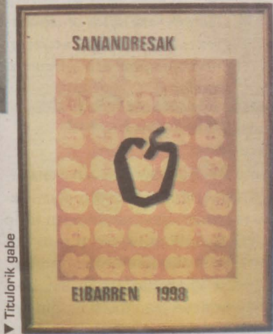
▼ Titulorik gabe

Konbentzioen oztoppo edo arazoa hezkuntza kontua ere badela deritza Leirek. «Beti uste izan dut hutsune bat dagoela hezkuntza arloan. Arte Ederrak ikasten hasi arte, ez dakizu artea existitzen denik; ordura arte arte