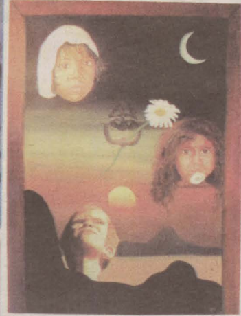
▼ Atearen bestaldean