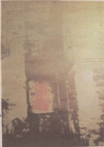
▼ Titulorik gabe

Oraingo izen handirik ez badute ere ez zaie iritzirik falta. Hurrengo arte joeren lekukoa dute eskuetan. Arteak badu jarraipenik.