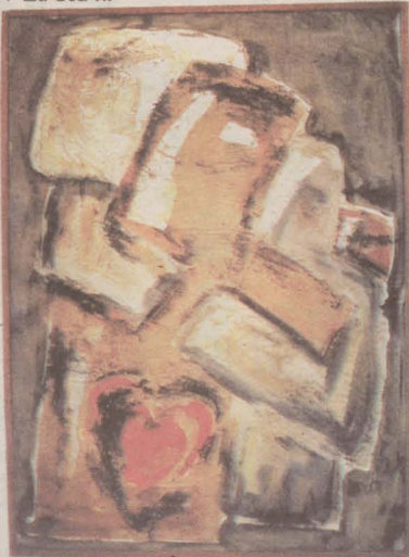
▼ Zu eta ni

■ Joerak: Oraindik bere estiloa lantzen diharduela dio. «Ama margolaria izanik, txikitatik izan dut mundu honetan aritzeko joera. Errealitatea islatu nahi izaten dut».