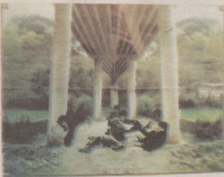
▼ Azpi hiria