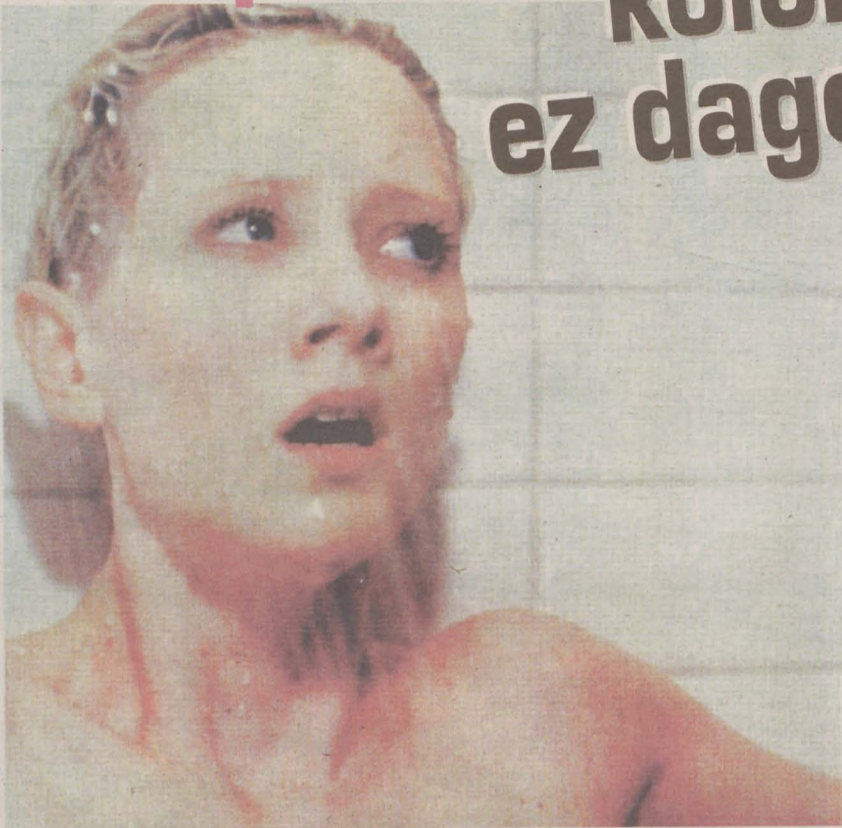
▲ Anne Heche aktorearen lanak kritika zorrotzak jaso ditu Estatu Batuetan.

Gus Van Sant-ek Alfred Hitchcocken Psycho film mitikoa berregin du. La planoz plano egindako bertsio horretan aldaketa gutxi dago. Dutzaren sekuentzia bere horretan utzi du zuzendariak