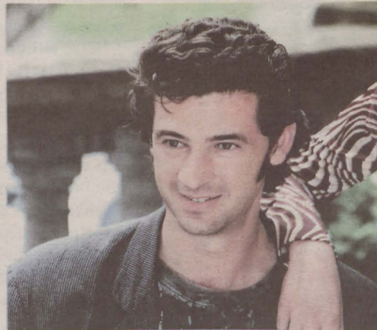
Julio Medem zinema zuzendaria. ▼

Lucía izanen da Julio Medem zuzendariaren bosgarren filma. Une hauean gidoian ari da lanean eta udaberri aldera hasi nahi luke filmatzen. Horretan ere Julio Medemen filmetan ohikoak diren aktoreek beteko dituzte rolik garrantzitsuenak. Horien artean Emma Suarez, Carmelo Gomez, Karrera Elejalde eta Najwa Nimri nabarmendu ditzakegu.