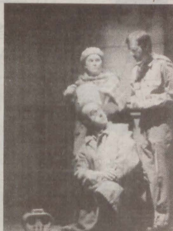
Desperrados obraren irudi bat. ▼

Ados taldearen 'Desperrados' lana Donostian. Ados antzerki taldeak Desperrados antzez-lana taularatuko du Donostiako Antzoki Zaharrean, bihar, etzi eta etzidamu, arratsaldeko zortzietan. Mende bukaerako gazte langabetuen egoera latza irribarrean galdu gabe salatzen duen