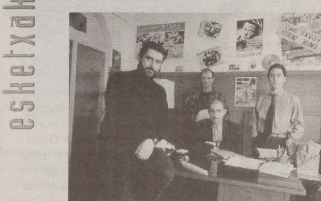
▲ Ibarretxe anaiak Sabotage pelikula filmatuko dute.

Ibarretxe anaien azken sabotajea. Ibarretxe anaiak Sabotage izeneko komedia filmatzen hasiko dira uda honetan. Sabotage nazioarteko ekoizpena da eta ingelesez errodaturik da. Istorioak Waterlooko Batailaren nondik norakoak kontatzen ditu umore eroz. Aktoreen artean Stephen Fry, David Suchet eta Dominique Pinon izango dira.