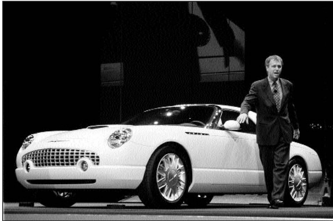
Ford Thunderbird berria, igandean, Detroiteko auto azokan.

Zurrumurruek ozen bilakatu ziren joan den astelehenean, Fordeko zuzendaritzaren inguruko iturri batek esan baitzuen astea bukatu aurretik BMW eta Hondarekin bat egiteko asmoa zuela. Hiru protagonistek berehala gezurtatu zuten berria. «Informazioak zurrumurruek eta espekulazioak besterik ez dira. Horren atzetik ez dago egirik», esan zuen asteartean Jacques Nasser Fordeko presidentea Detroitetik irratian. «Hego haizea baino zaharragoa da istorio hori», ziurtatu zuen München BMWko bozeramaile batek. «Antzeko plan bati buruz ez dut entzun ere egin. Gainera, gure marka aspaldi garatu dugu bi konpainiok (BMWk