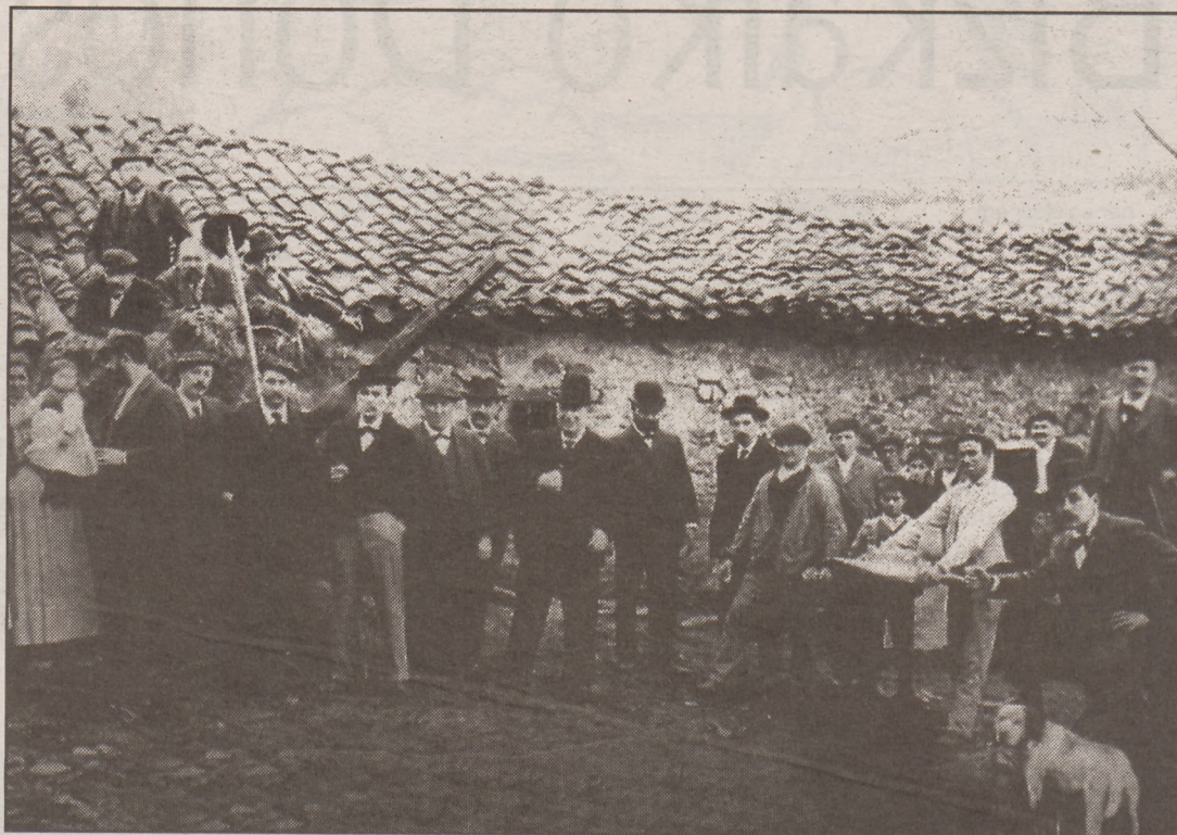
Euskal giroa bultzatzea dute helburu jai hauek.

Euskal Txokoak ez du inolako dirulaguntzarik jasotzen jai antolatzeke, eta diru sarrera bakarra txosnek ematen dutena da. Justugune Otxarkoagako berezko jai da, bertako sustraian oi-