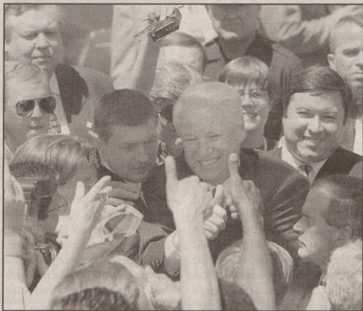
Jende asko inguratu zen Boris Jeltsinen hotelera, hura agurtzera.