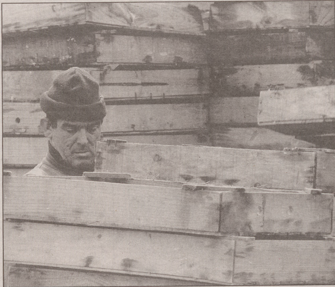
Antxoa kaxa gutxi bete ahal izan dituzte aurten Hegoaldeko baxurako arrantzaleek.

Olaizolaren ustez, arrantzaleen artean badago baliabide hori desagertuko den beldurra. «Antxoak lau urteko bizia du, baina antxoa txiki asko hiltzen da. Beste arrain batzuen bila joanda