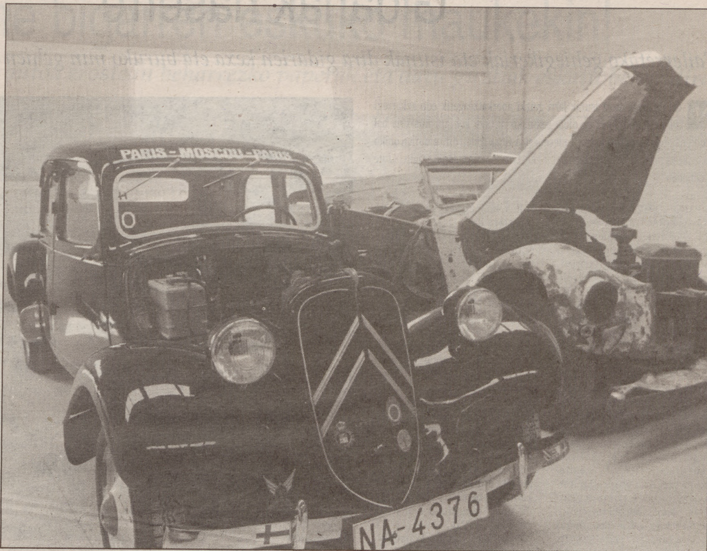
Hamar urte baino gehiago dituzten autoak onartzen ditu Prever planak. EDURNE KOCH

Prever plana mugagabea da, hau da, ez da finkatu dirulaguntzen eta neurrien bukaera datarik. Planaren helburua auto zaharren portzentaia jaistea da, Espainiako autoen herenek (bost milioi inguru) hamar urte baino gehiago baitituzte; auto guztien laurdenek, berriz, hamabost urte baino gehiago.