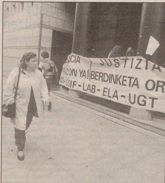
Justizia zerbitzuetako langileen atzoko protesta Bilbon.

Bilbon, bestalde, salaketa jarriko dute Justiziako Epaitegi Gorenean, herenegun Donostia-ko epaitegian ez zitelako sartzen utzi. Greba laguntzen duten sindikatuek - ELA, LAB, UGT, CCOO eta CSIF- aurkeztuko dute salaketa, Eusko Jaurlaritzak greba egiteko eskubidea eragotzi zuelakoan. X