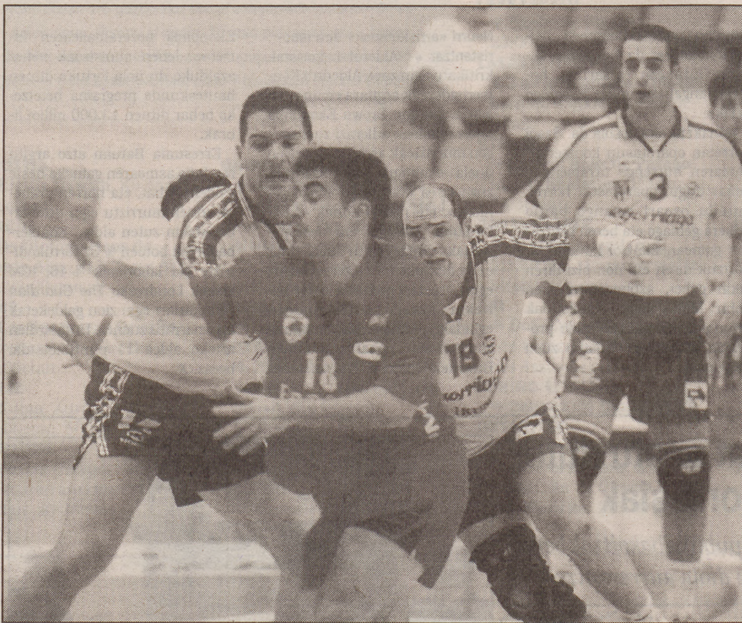
Bidasoak baja garrantzitsuak dituela jokatu du gaur Ademar Leonen aurka.