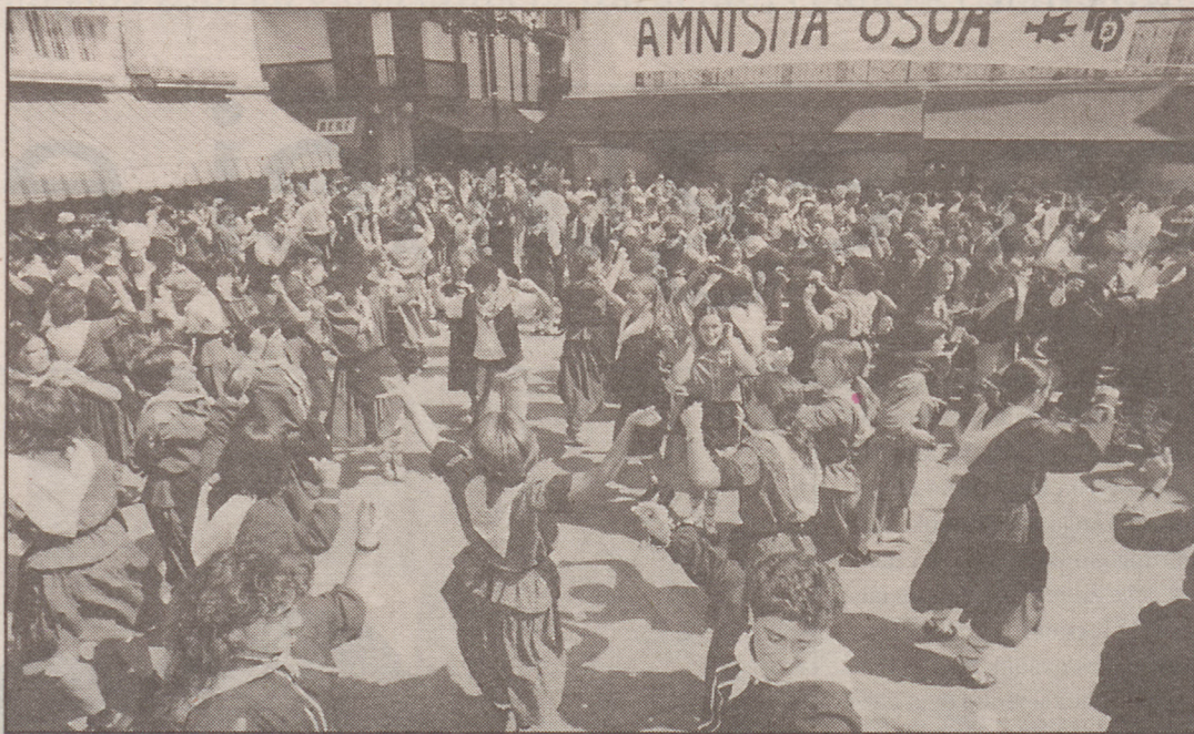
Eguraldia lagun, giro ezin hobean igaro zuten zarautzarrek aurtengo Euskal Jai Eguna. ♦ EDURNE KOCH

Bazkaltzera joan aurretik herriko plaza gehienetan zeuden, urtero bezala, trikitilariak, txistulariak... Ai, eta sueltoan ez dakienak zer egin, bere lagun guztiak dantzan dabiltzala ikusita. Badauzka aukerak, batzuk betikoa, «hurrengo urterako sueltoa ikasi behar dut, erakutsiko didazu zuk?». Beste batzuek lotsarik gabe ekiten diote dantzari, «gaizki edo ondo, nik behintzat dantzan egiten dut, nahiz eta nire kontura guztiak barrez aritu». Atzo dantzan ez zekien batek jarritako aitzakia, agian, hurrengo urtean askorentzako baliagarria izan daiteke: «Ez, ni txakolin botila zaintzen geldituko naiz».