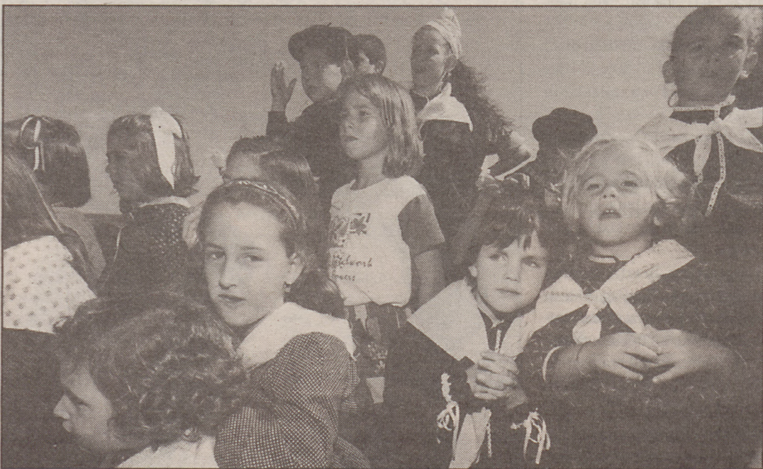
Baserritarrez jantzi ziren, ohiturari men eginez, herritarrek eta herrira hurbildutako guztiak. ♦ EDURNE KOCH

Musika plazan, Barren plazan, Bizkaia kalean kokatu ziren txosnetan, guztietan zabaldu ziren baserritarrek erromeria giro alaian, eguraldia lagun. Kanpotarrak ere ugari ziren atzo Zarautzen. Urtez urte gero eta jende gehiago hurbiltzen da Euskal Herriko alde guztietatik Zarauzko Euskal Jai Eguna ezagutzera. Aurtun irailaren 9a astelehena izan arren, ez zuen horrek urtero Zarautzen biltzen den jendetza-rengan eraginik izan.