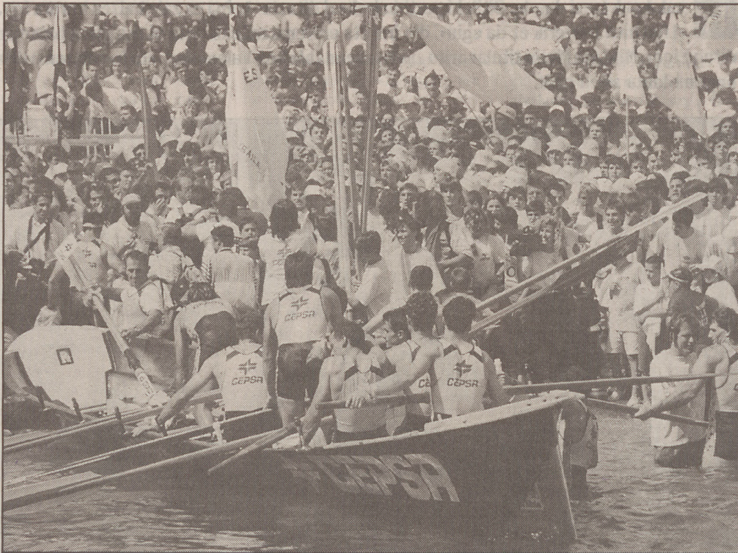
Orioko arraunlariak Donostiako kaian lurreratzen.

Orioko entrenatzailearen ustez, aurtun asmatu egin dute denboraldian egindako lanarekin. Laz, denboraldian zehar talde onena izan arren, Kontxan huts egin zuten. «Aurtun San Pedro