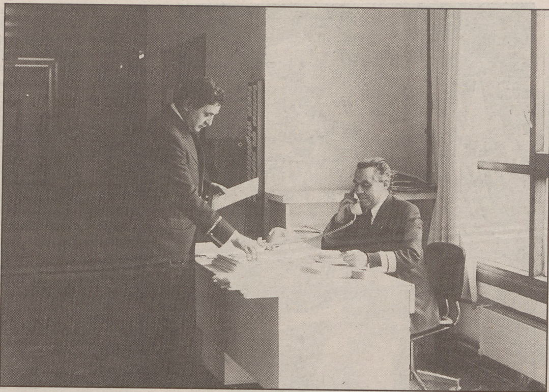
Urte amaierara arte, Jaurlaritzak funtzionarioekin negoziatu beharko du ea eskaintza onartzen duten.

Sindikatuak planaren aurka daude. • Gobernu Kontseiluak plana onartu ondoren, urte