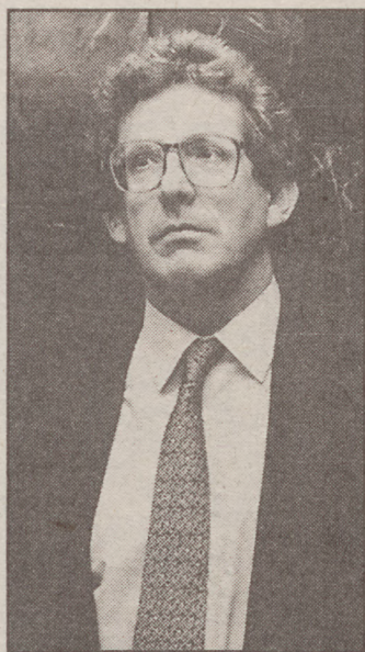
Pedro Miguel Etxenike azalen fisikaren alorrean egin dituen lan garrantzitsuengatik saritu dute.

Egun EHUko Donostiako Kimika fakultatean Materia Kondentsatuaren Fisika katedra betetzen du Etxenikek. Duela 46