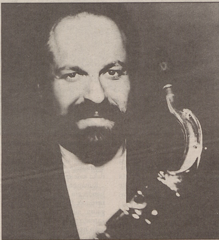
Herbie Hancockek haurrekin lortu ez zuen komunikazioa erdietsi zuen helduekin herenegun. Gaur Joe Lovano eta Jim Hall-en taldearen txanda izango da.