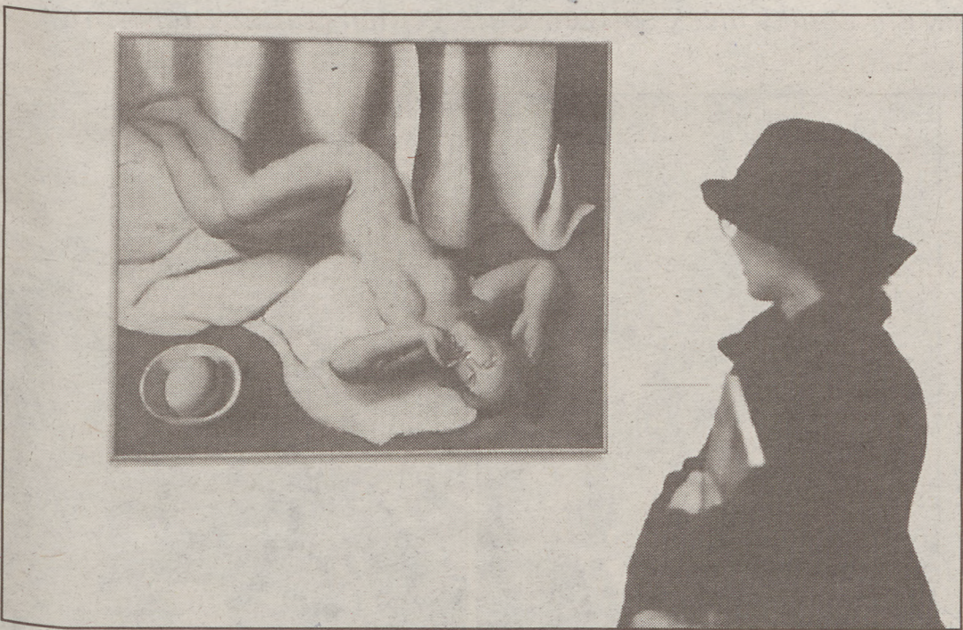
Pinturek, eskulturek eta marrazkiek osatzen dute apirilaren 14ra arte zabalik izango den erakusketa.

A rtista Iberikoen Elkarteko partaideen lanek osatzen dute Bilboko Arte Ederretako Museoan apirilera arte zabalik egongo den erakusketa. 37 artistaren 160 lan dira. Artearen mundua «irauli» egin zutela diote adituek. Elkarteko kide izan ziren Uzelai, Gezala, Arteta, Tellaetxe, Etxebarria, Zubiaurre, Urrutia eta abar. Hauen lanekin batera Dali edota Barradasenak daude ikusgai Bilbon.