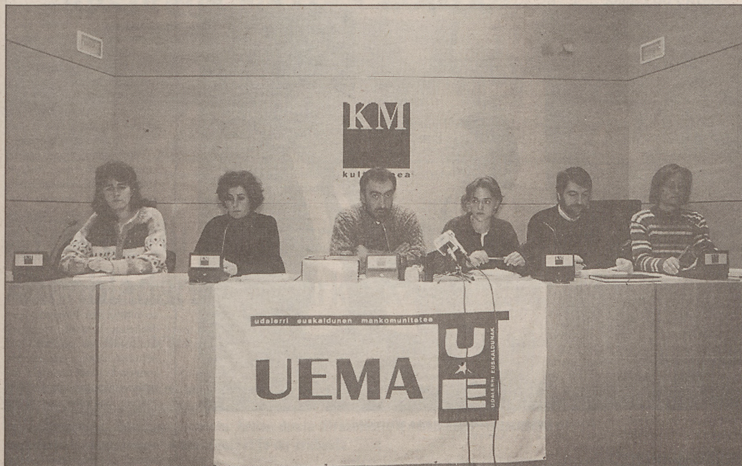
UEMA sartzeara erabaki duten herrietako ordezkariek mankomunitateko kideekin atzo eskaini zuten prentsaurrekoan.

U dalerri Euskaldunen Mankomunitatean (UEMA) sartzeko sinatze ekitaldia egin zuten atzo Altzaga, Elduain, Zaldibia, Itsasondo eta Ikaztegieta ordezkariek. «Udalerri euskaldun guztiak batuz lau haizeetara zabaldu nahi dugulako» sartu dira mankomunitatean bost herri horiek.