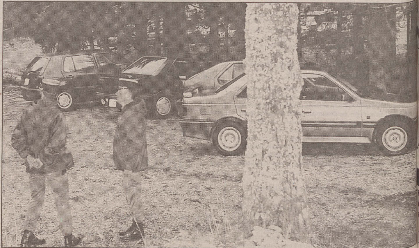
Jandarme frantziarrak atzo, hildakoen autoak aurkitu zituzten Vercorseko basoan.

Tokian bertan ez zen identifikaziorik egiteko modurik izan, gorpuzkinak ia erabat erreta baitzeuden; hala ere, 16 lagun, 13 heldu eta hiru haur, zirela jakinarazi zuten jandarmek. Hasieran 14 zirela zabaldu zen, baina kiskalitako gorpua ondo aztertu ondoren ikusi ziren 16 zirela biktimak. Erdiak frantziarrak ziren eta besteak, aldiz, Suitzakoak. Ustezko buruhiltzaia ikertzen ari den epaileak jakinarazi duenez, gorpuzkinen egoera dela eta, hainbat egun beharko dituzte hildakoko zeintzuk diren zehazteko.