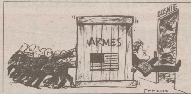
PANCHO / LE MONDE

Pastoralzale nintzan joan den igandean eta, Arrokiagako itzulua egirik, Euskal Herriko herri tipienetarik batek egin duen balen-