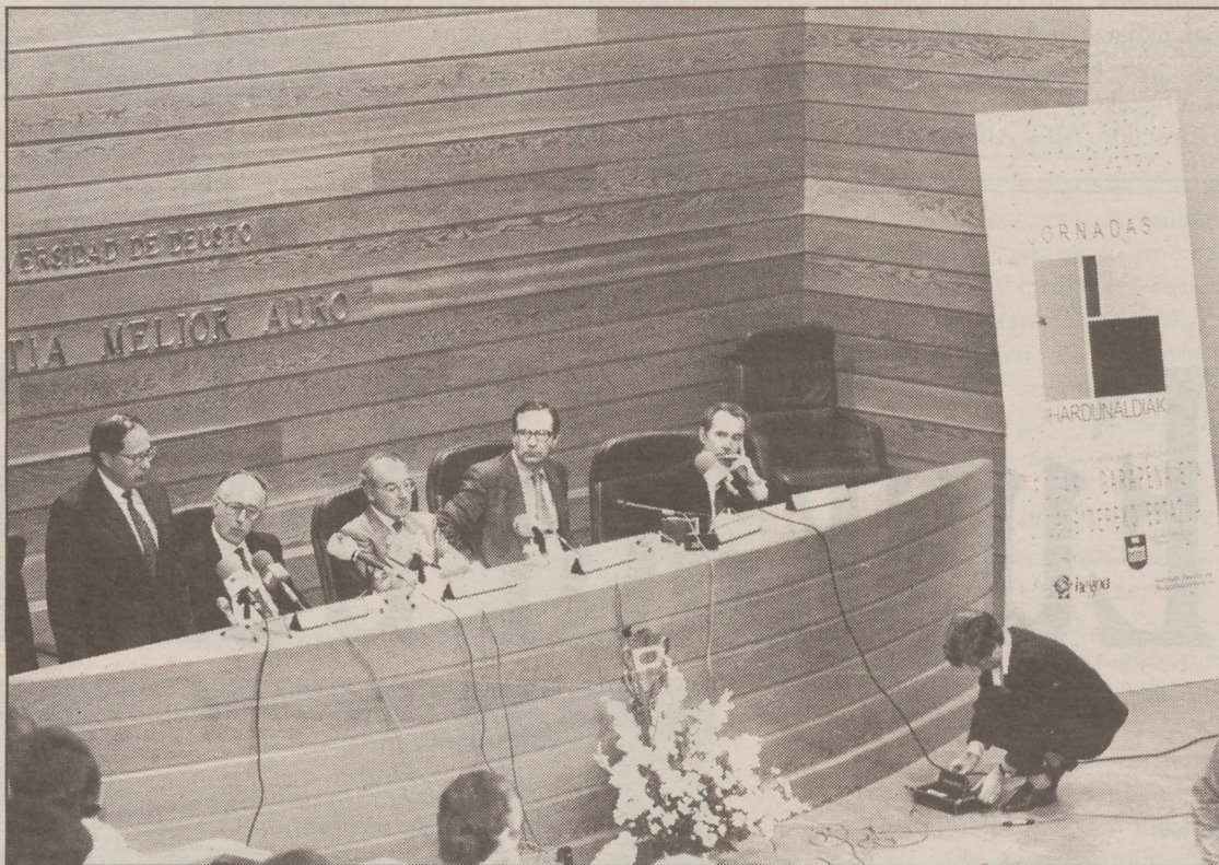
‘Drogak, garapena eta zuzenbidezko estatuak’ jardunaldiak egiten ari dira Bilbon.

Atzoko jardunaldian Antonio Aranibar Boliviako Kanpo Harremanetarako ministroak ere hartu zuen parte. Koka landatzea «nekazaritza munduak bizi duen pobrezia-ekin» lotu zuen Aranibarrek baita 80ko hamarkadan izan zen meategien itxierarekin ere.