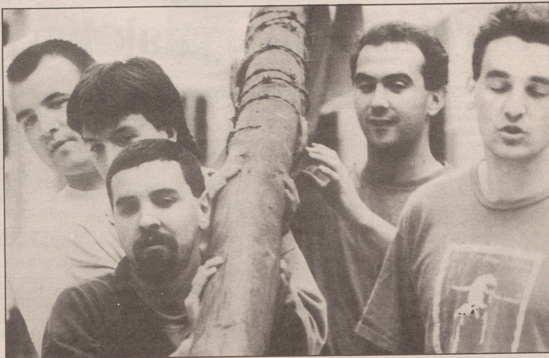
Jaietako lehen egunean berriztarrek enbor hau landatzen dute herriko enparantzaren erdian.

Horren jakitun, beraz, guk geuk ere ekin genion jaietan murgiltzeari. Ondorengo ez dizkizuegu guk kontatuko, ia-ia gaztetxoek hazainak ere gauditu baikenituen.