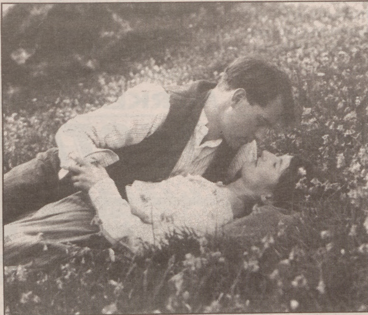
Pelikula Hedd Wyn poeta galesaren historia kontatzen du.