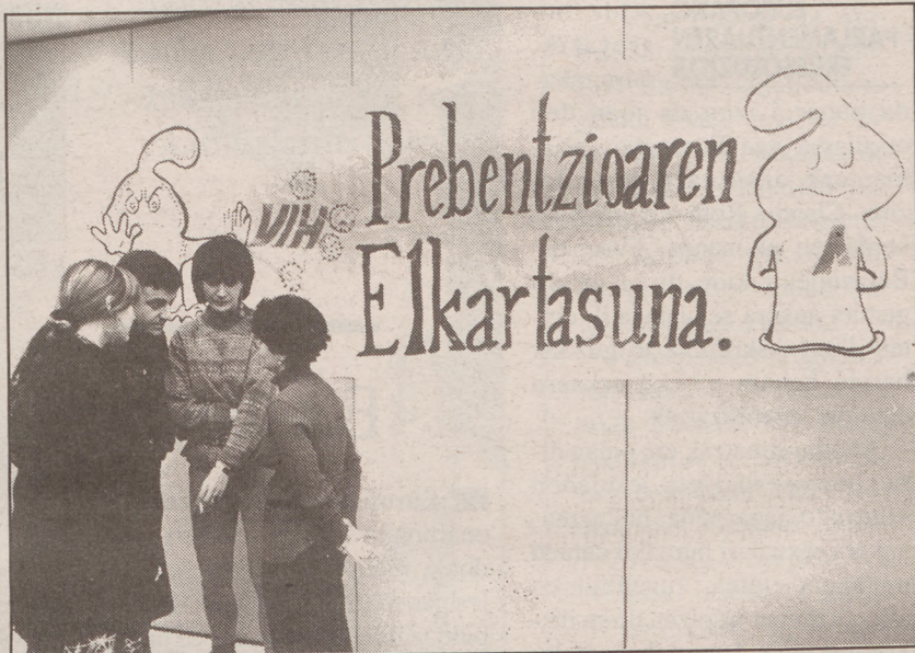
Presebatiboaren erabilera zein bestelako profilaktikoa ezinbestekoa da.