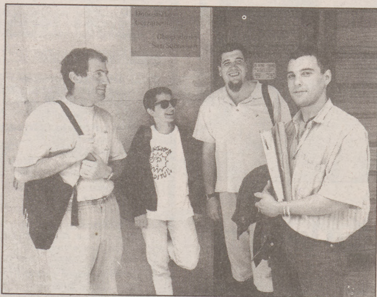
Gipuzkoako apostasiaren aurkezpena.

Euskal Herrian EHGAMek bideratu du apostasia kanpaina, nahiz eta lesbiana talde desber-