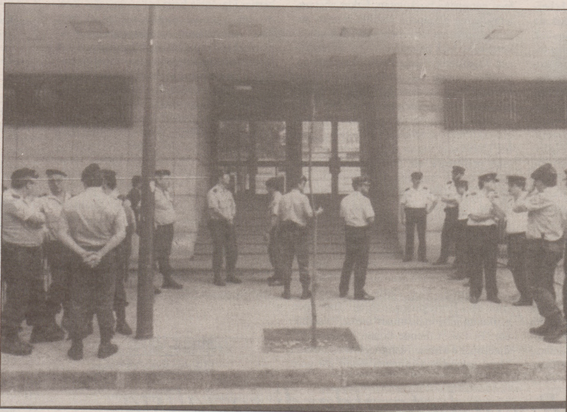
'Sokoako paperen' inguruko lehen epaiketa da atzo Entzutegi Nazionalan hasitakoa.