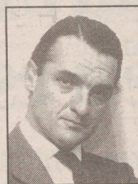
MARIO CONDE Banestoko lehendakari ohia