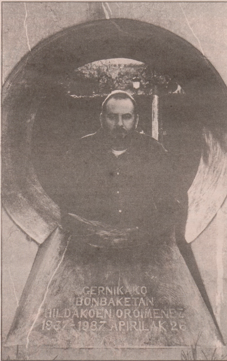
'Guernica' koadroa Gernikara ekartzeko eskatu du Arejitak.

Emakume eta umeekin gauza bera gertatu zen, metrailatu eta