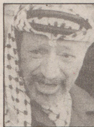
IASSER ARAFAT PAEko presidentea EL PAIS

«Espainia maitatzea proiektu nazional handi batekin bat etortzea da. Baina ez dezagun nahastu nazioa Estatuarekin. Maita dezagun den moduan: anitza eta plurala bere batasunean»