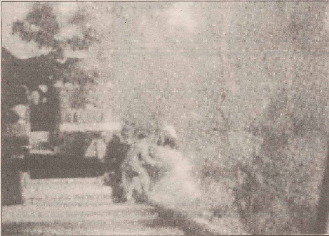
Um Qasr hiriko instalakuntzak desegiteko arduradun irakiarrak lanean.

Lawrence Eagleburger Etxe Zuriko bozeramaileak, Iraken jarreraren aurrean «erantzuna beharrezkoa» zela iragarri ondoren, George Bush EEBBetako jarduneko lehendakariak ez zuen denbora asko behar izan berria ofizialki iragartzeko: Pertsiar Golkoko inguruan alerta egoeran dauden indar militar estatubatuarrek Iraki erasotzeko agindua jasotzen atzo arratsalderako.