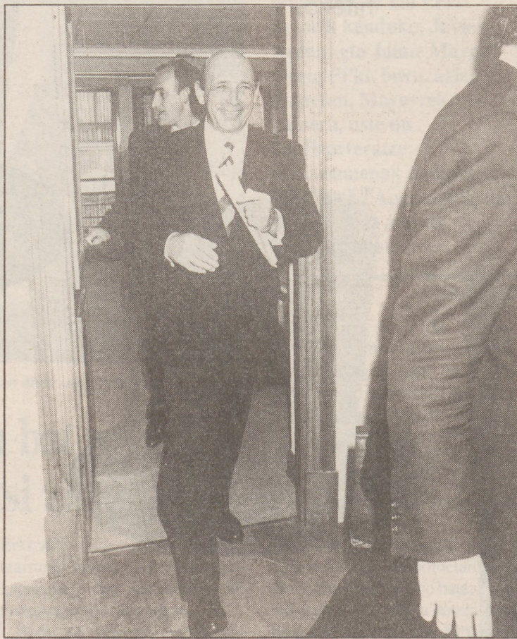
Galdos eta Sudupe epaitegitik irteteko unean.

Billabonan zubibide bat egiteko zen Gipuzkoa eta Nafarroa lotuko dituen autobideko lanetan baina bertako udalak obra honen