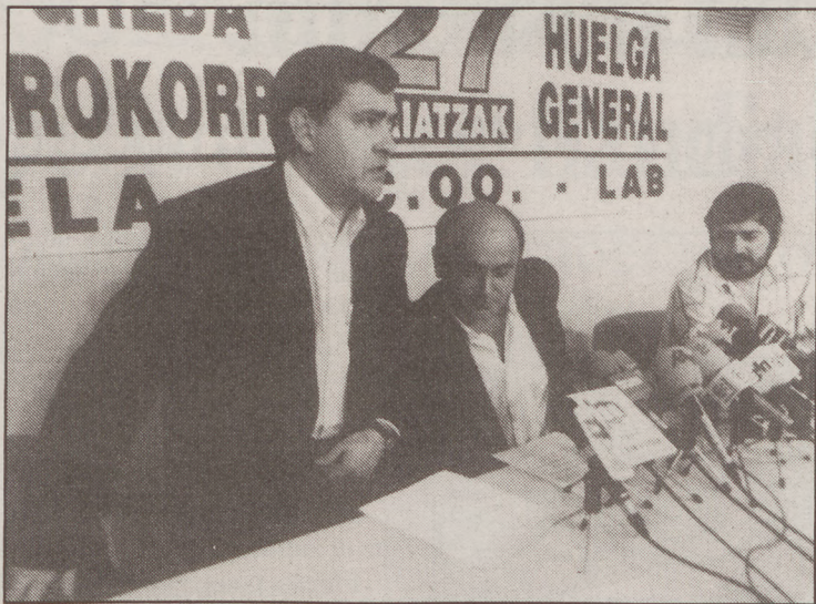
ELA, CCOO eta LABeko idazkari nagusiak.