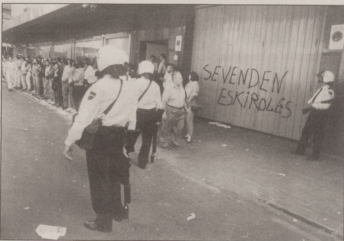
Bilboko Corte Inglesean bildutako piketea.

Era berean, tren konpainiak dituen autobus zerbitzuek ere ez zuten funtzionatu.