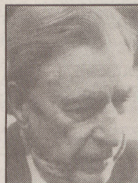
JOHN KENNETH GALBRAITH Ekonomialaria eta Nobel sariduna

«Ni, Jaurizaritza naitzen aldetik, sinetsirik nago gure industriarentzat ageri diren bide onez»