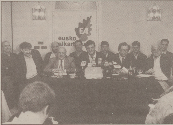
Muruak farsante deitu zion Arzalluzi prentsaurrekoan. A. GILNEEA

Muruaren ustez, San Lorentzo izeneko alternatibaren onarpena «ikuskari lotsagarria» eta «iruzur politikoa» izan da. Zazpi urteko